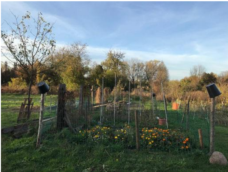
Dank der Förderung durch das Bonifatiuswerk kann das Freigelände erblühen.