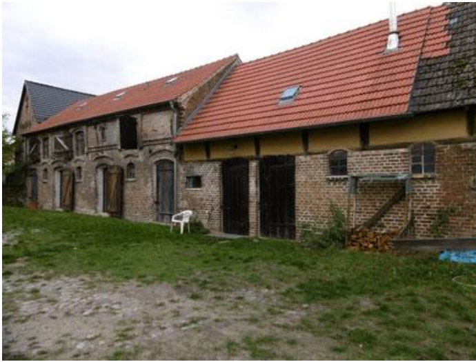
Der ehemalige Pferdestall wurde restauriert (2009-11)