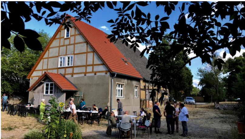
Auch der Anbau, genannt Haupthaus, konnte saniert werden (2011).