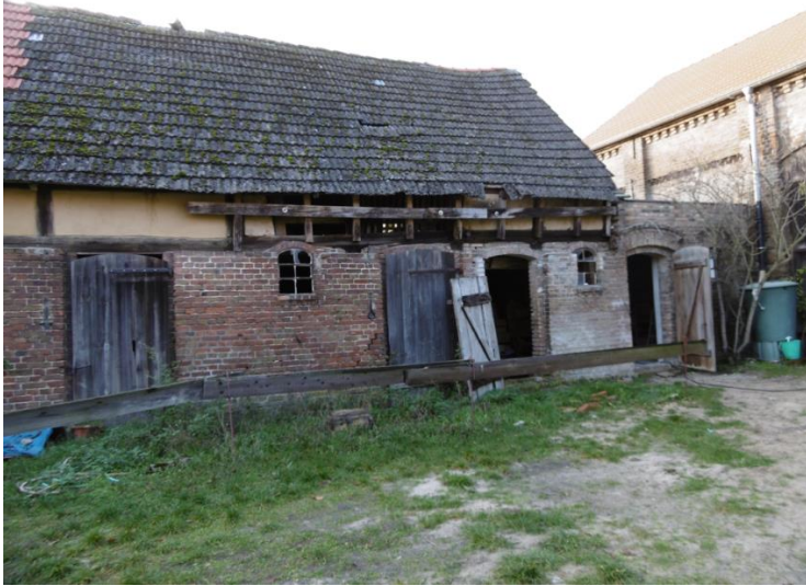
Ein alter Stall, der eine neue sanitäre Anlage beherbergt (2019).