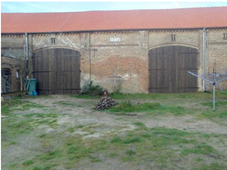
Die Scheune bekam ein neues Dach und neue Tore (2019).