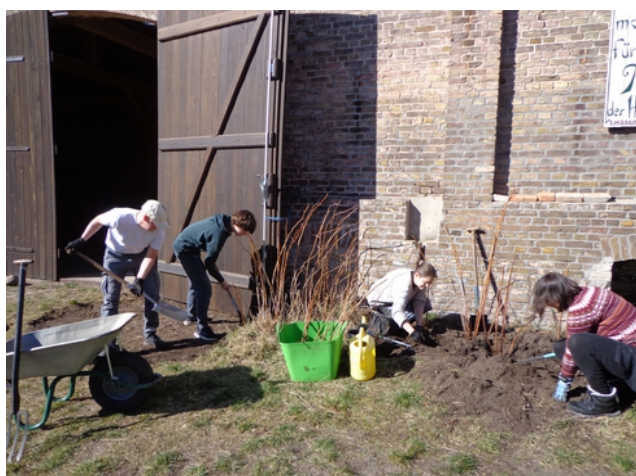
2022-03 Himbeeren versetzen Scheunentor mit voller Öffnung

Die Regentonne im Innenhof ist wieder angeschlossen. Nun warten wir dringend auf Regen. Schon am Dienstag zuvor haben wir zu zweit alle Heidelbeeren in ein neues Beet umgesetzt. Sie standen dort, wo der kommende Grenzzaun gezogen werden soll (10 Arbeitsstunden).